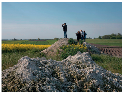
Plener