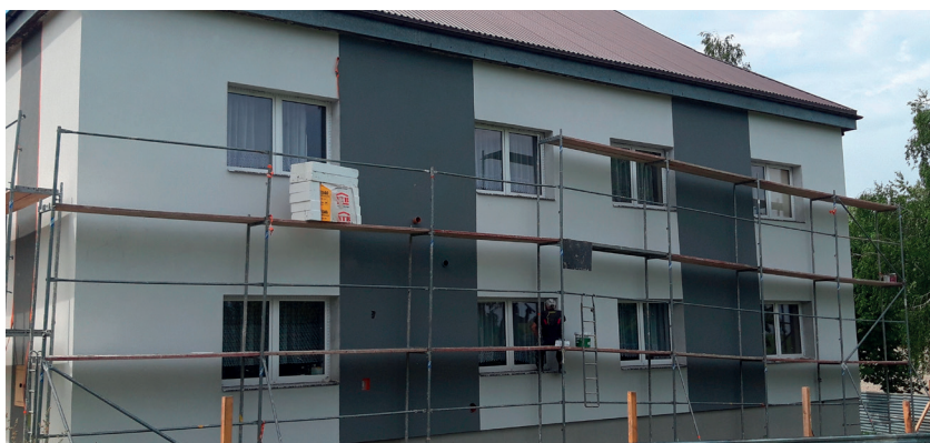
Dąbrowa. Modernizacja świetlicy wiejskiej