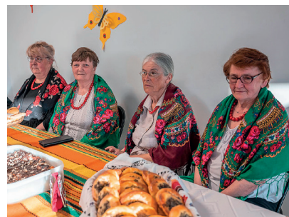
KGW Polany