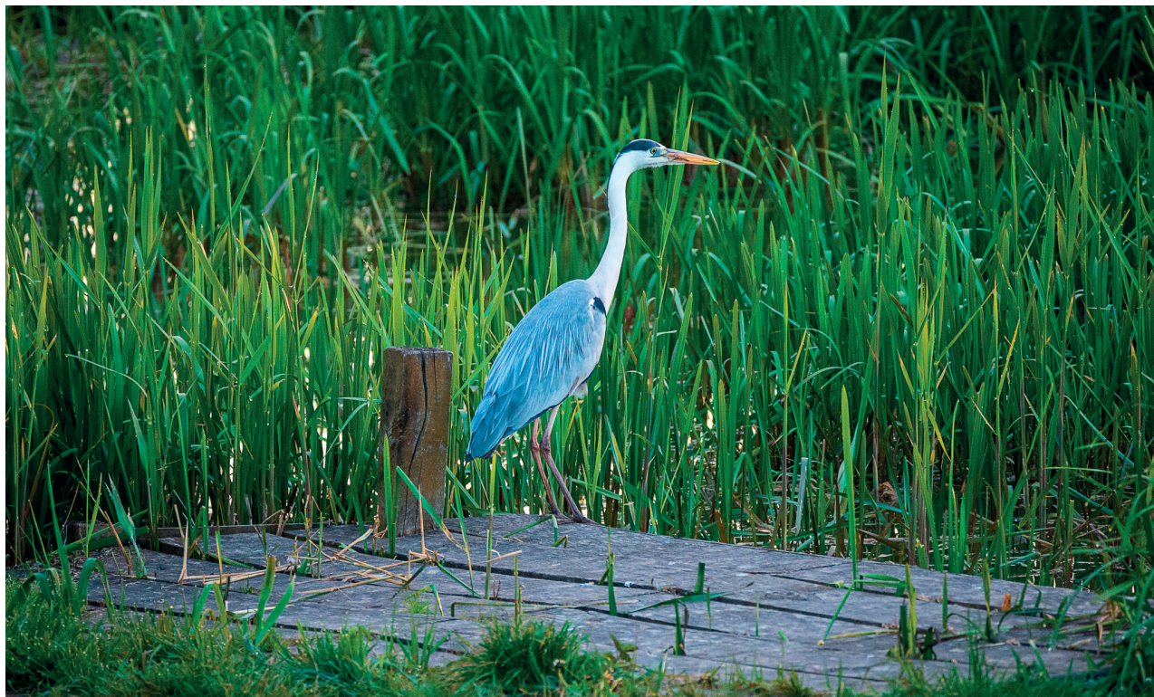
Czapla