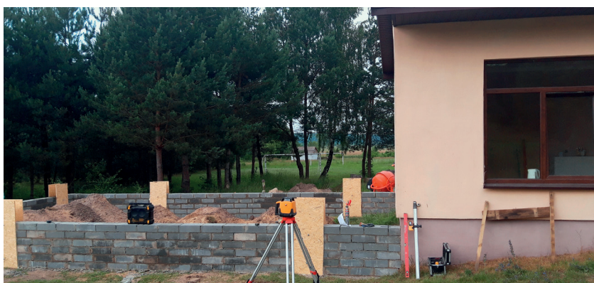
Zaboreczno. Rozbudowa świetlicy