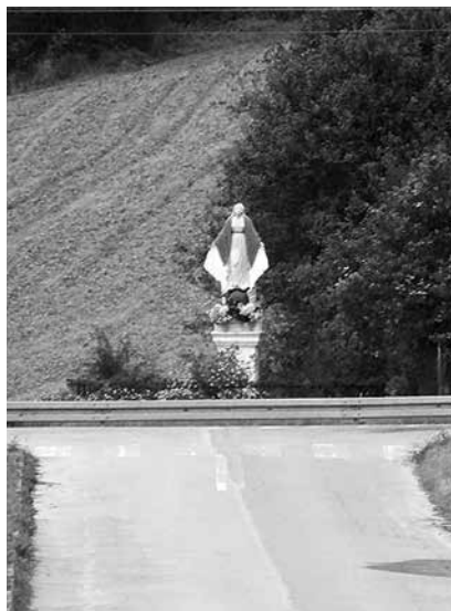
Figura NMP w Żwiartowie, świadek wielu dramatycznych historii wojennych