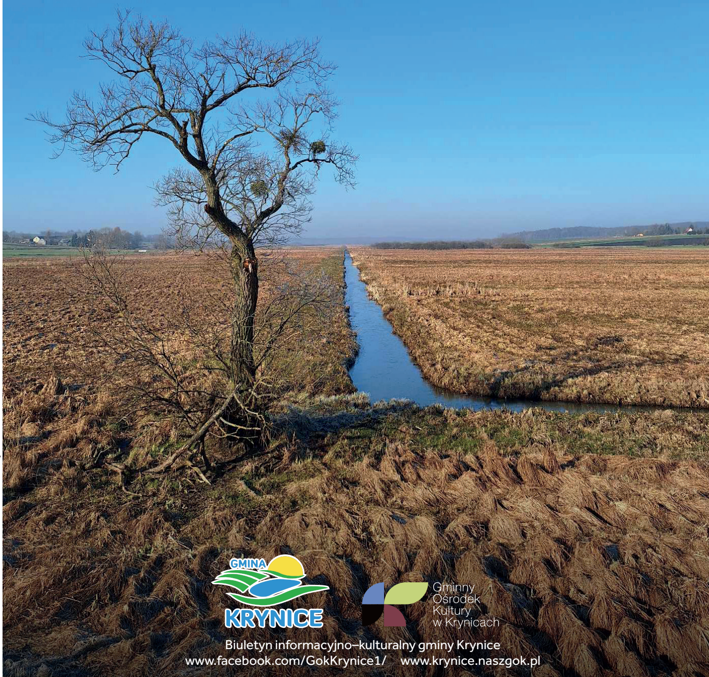
Przedwiośnie w dolinie Kryniczanki